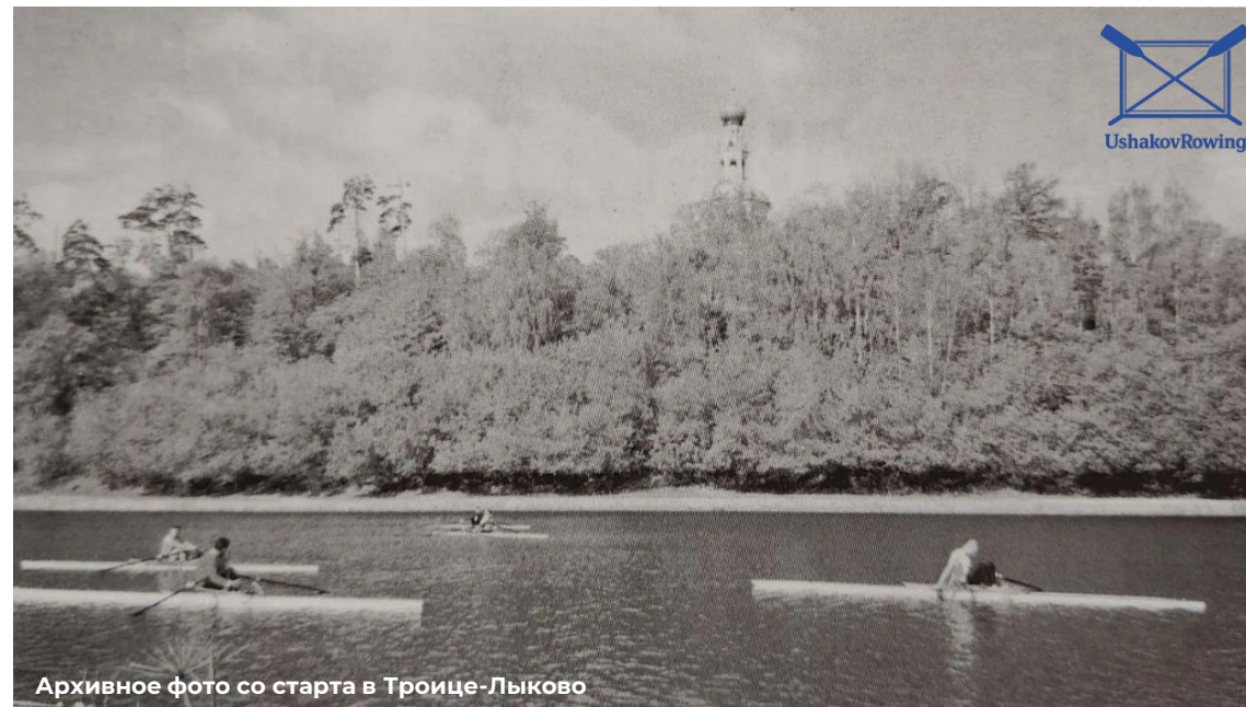
Архивное фото со старта в Троице-Лыково